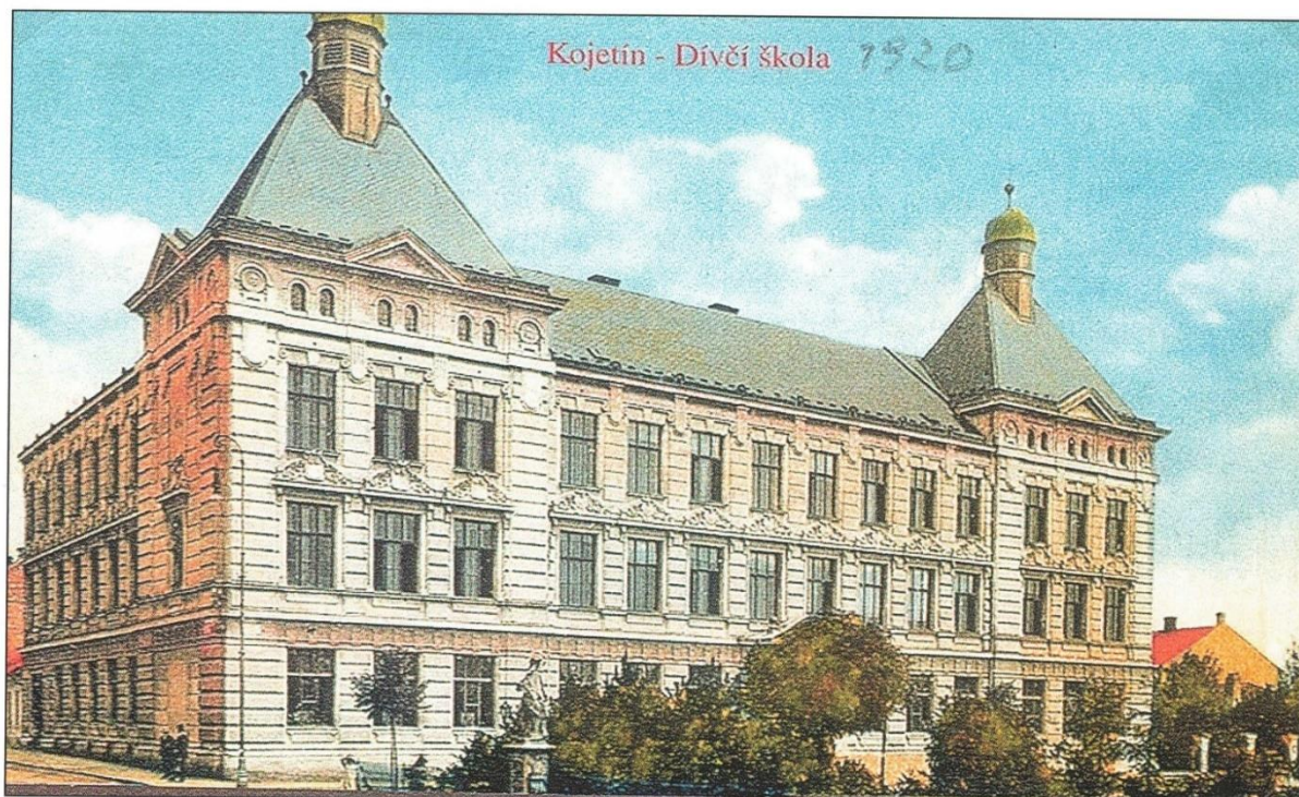
„Dívčí škola“, dnešní ZŠ náměstí Míru, v roce 1920

Dne 5. 12. 2023 oslavila naše škola 120 let od otevření. V rámci tohoto výročí škola připravila pro veřejnost venkovní galerii, kde prezentovala svou činnost.